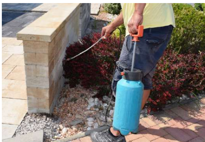
aplikácia prípravku pomocou záhradného postrekovača