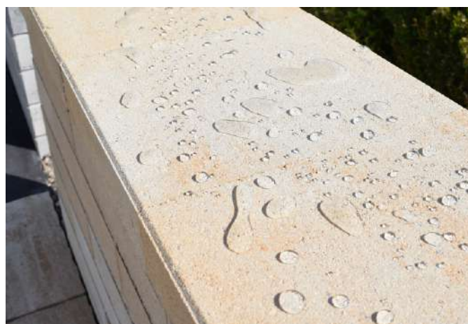
ochranná vrstva po aplikácii zabraňuje prenikaniu nečistôt