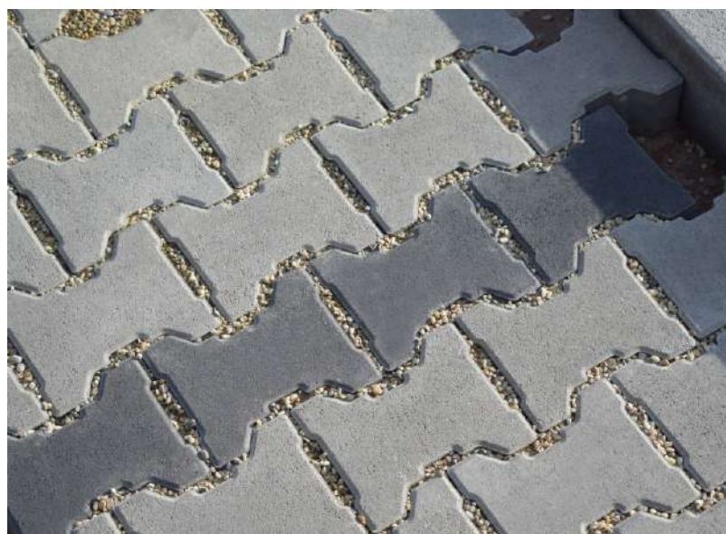
farba sivá, grafitová

Nie je možné objednávať formáty jednotlivito! Hmotnosť výrobkov je uvádzaná vrátane váhy drevenej palety! Dovož z výrobného závodu Šála.