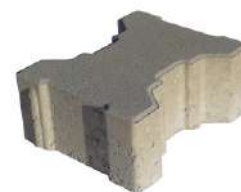
16,5 x 20 x 8 cm

TIP: Tvar dlažby umožňuje uloženie na dva spôsoby: 1. Na väzbu, čím vzniknú menšie drenážne otvory. 2. Ukladanie v línií vytvorí medzi dlaždicami väčšie, tvarovo zaujímavé medzery.