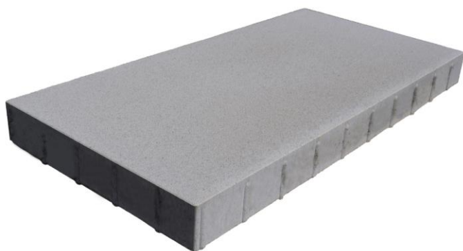
100 x 50 x 8 cm